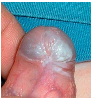
Abbildung 2: Bei noch reponibler Vorhaut ist der perifrenuläre Befall mit Frenulum breve deutlich zu erkennen.