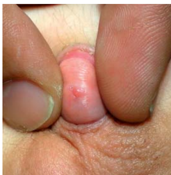
Abbildung 3: Meatusstenose 4 Monate nach Beschneidung wegen Lichen sclerosus

Bemerkenswert erscheint, dass sich die Meatusstenose noch nach einigen Jahren entwickeln kann, ohne dass eine Persistenz oder ein Rezidiv des Lichen sclerosus nachweisbar wäre (e5). Eine Erklärung könnte in der Mangel durchblutung des Meatus nach Sklerosierung der Frenulumregion liegen (e6).